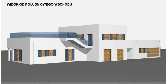
WIDOK OD POLUDNIOWEGO-WSCHODU