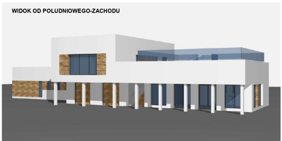
WIDOK OD POLUDNIOWEGO-ZACHODU