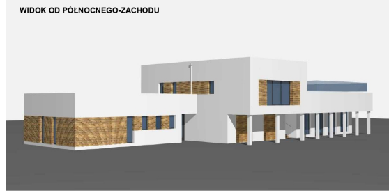
WIDOK OD PÓLNOCNOWEGO-ZACHODU