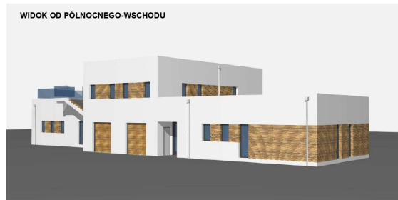
WIDOK OD PÓLNOCNOWEGO-WSCHODU