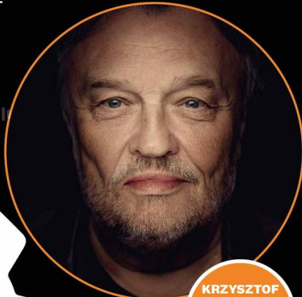
KRZYSZTOF CUGOWSKI z Zespołem Mistrzów 3.09.2023 godz. 20:30