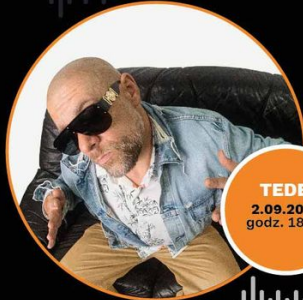
TEDE 2.09.2023 godz. 18:30