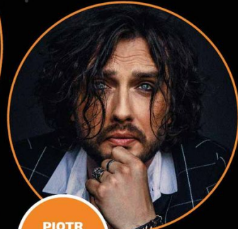
PIOTR CUGOWSKI 3.09.2023 godz. 19:00