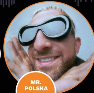
MR. POLSKA 2.09.2023 godz. 20:00

STREFA GASTRO STREFA PARTNERÓW MŁODZIEŻOWY ART PATROL STREFA AKTYWNOŚCI PARK ROZRYWKI