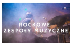
PROWADZI KRZYSZTOF STANIK