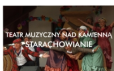
PROWADZI MAŁGORZATA WYDERSKA