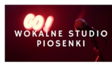
PROWADZI PIOTR MRÓZEK