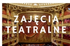
PROWADZI ZUZANNA KĘDZIORA