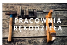
PROWADZI RADOŚLAW PŁUSA