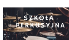
PROWADZI GRZEGORZ DZIAMKA