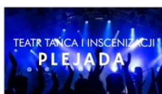
PROWADZĄ ALICJA ANDRZYKOWSKA KATARZYNA LIPIEC