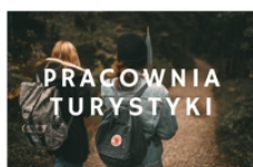
PROWADZI RADOŚLAW PŁUSA