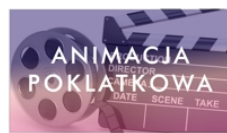
PROWADZI KACPER CELUCH