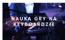
PROWADZI PIOTR MRÓZEK