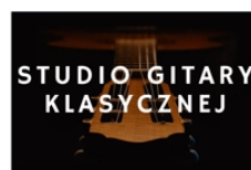
PROWADZI WALDEMAR DZIURA