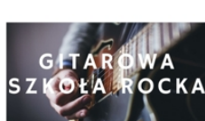
PROWADZI KRZYSZTOF STANIK