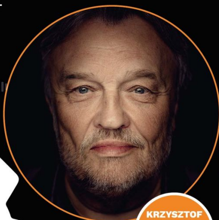
KRZYSZTOF CUGOWSKI z Zespołem Mistrzów 3.09.2023 godz. 20:30