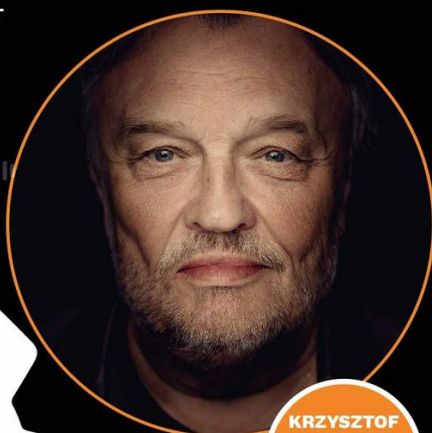
KRZYSZTOF CUGOWSKI z Zespołem Mistrzów 3.09.2023 godz. 20:30