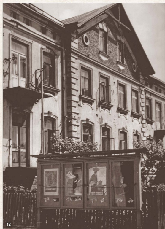
Kamienica czynszowa Giepardów przy ulicy Kolejowej 17. Był to najbardziej reprezentacyjny gmach w dawnym Wierzbniku, wyróżniający się wielkością i ozdobną elewacją fasady. W latach I wojny światowej mieściła się tu siedziba okupacyjnych władz austro-węgierskich. Na pierwszym planie znajduje się gablota z plakatami filmowymi kina, które znajdowało się na lewo od kamienicy; fotografia z połowy lat 50. XX w.