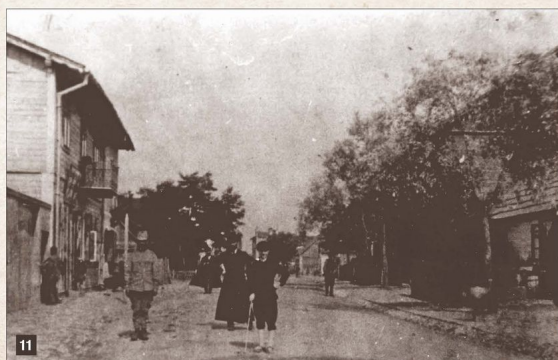
Zabudowa ulicy Starachowickiej (obecnie Piłsudskiego) w latach I wojny światowej