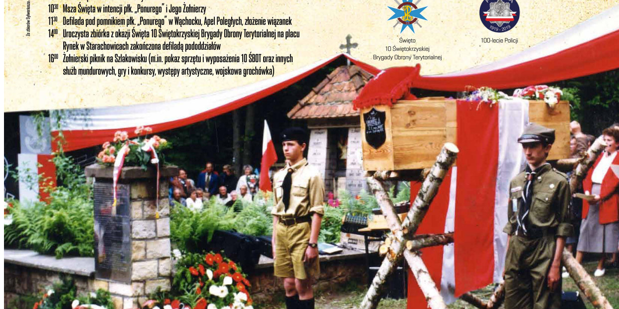
Wspieracie organizacyjnie i finansowo w organizacji uroczystości