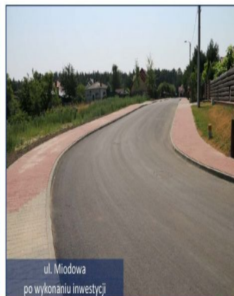
ul. Miodowa po wykonaniu inwestycji