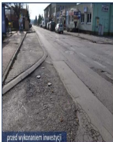
przed wykonaniem inwestycji