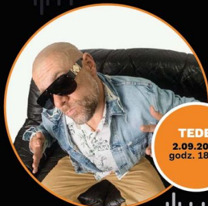
TEDE 2.09.2023 godz. 18:30