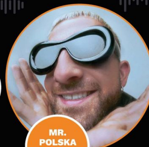
MR. POLSKA 2.09.2023 godz. 20:00

STREFA GASTRO STREFA PARTNERÓW MŁODZIEŻOWY ART PATROL STREFA AKTYWNOŚCI PARK ROZRYWKI